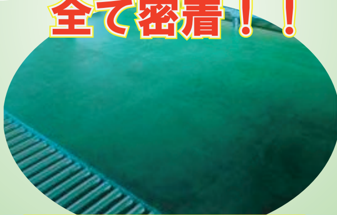
表面強化コンクリート（カラーコンクリート）