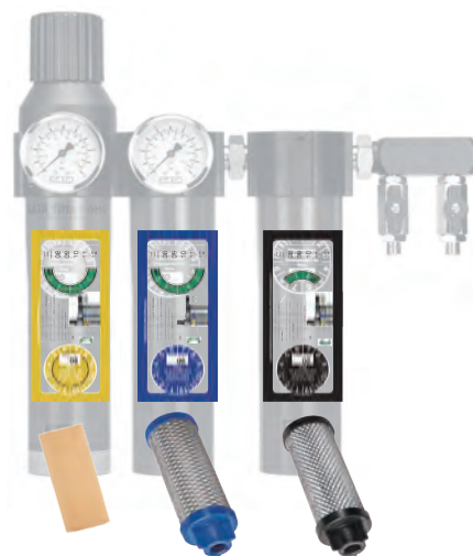
First Filter Second Filter Third Filter