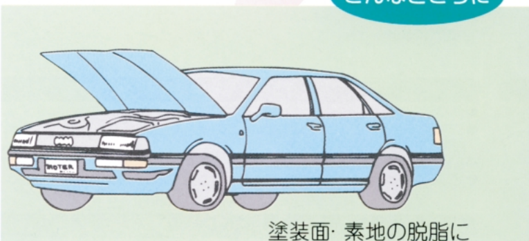
塗装面・素地の脱脂に