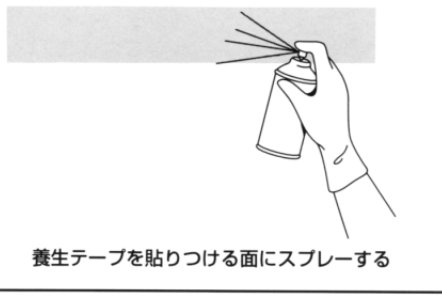
養生テープを貼りつける面にスプレーする