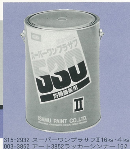
315-2932 スーパーワンプラサフⅡ 16kg・4kg 003-3852 アート3852ラッカーシンナー 16ℓ